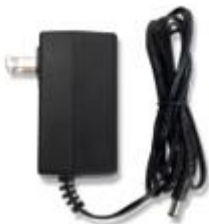
Adaptor de alimentare